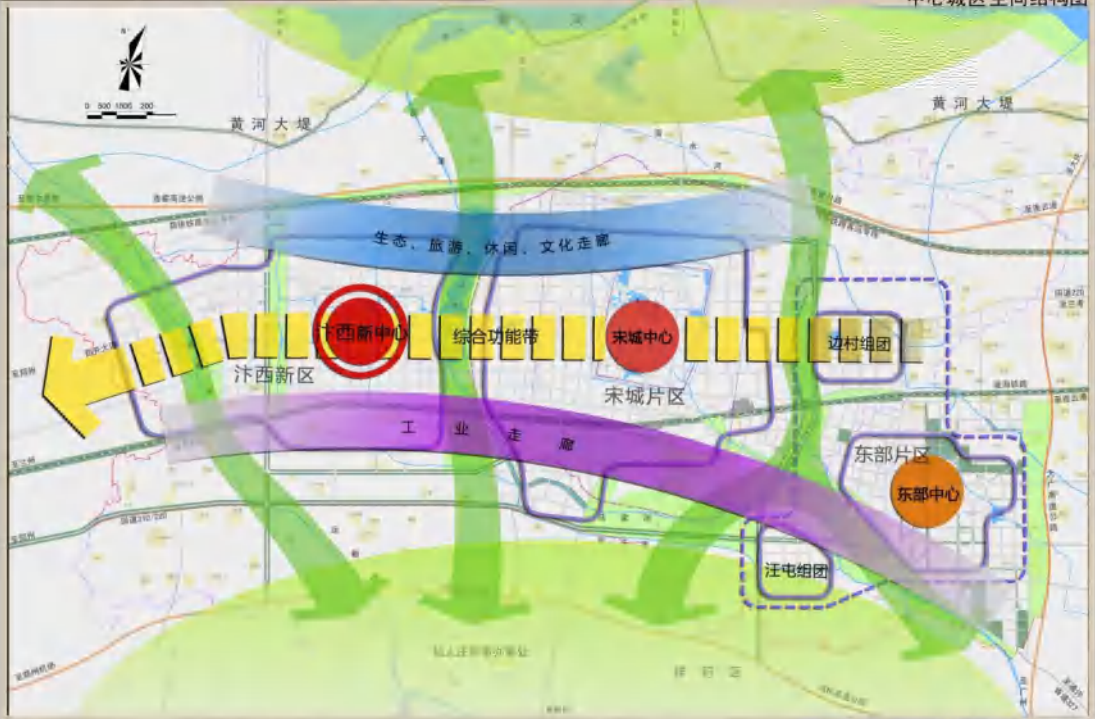
中心城区空间结构图