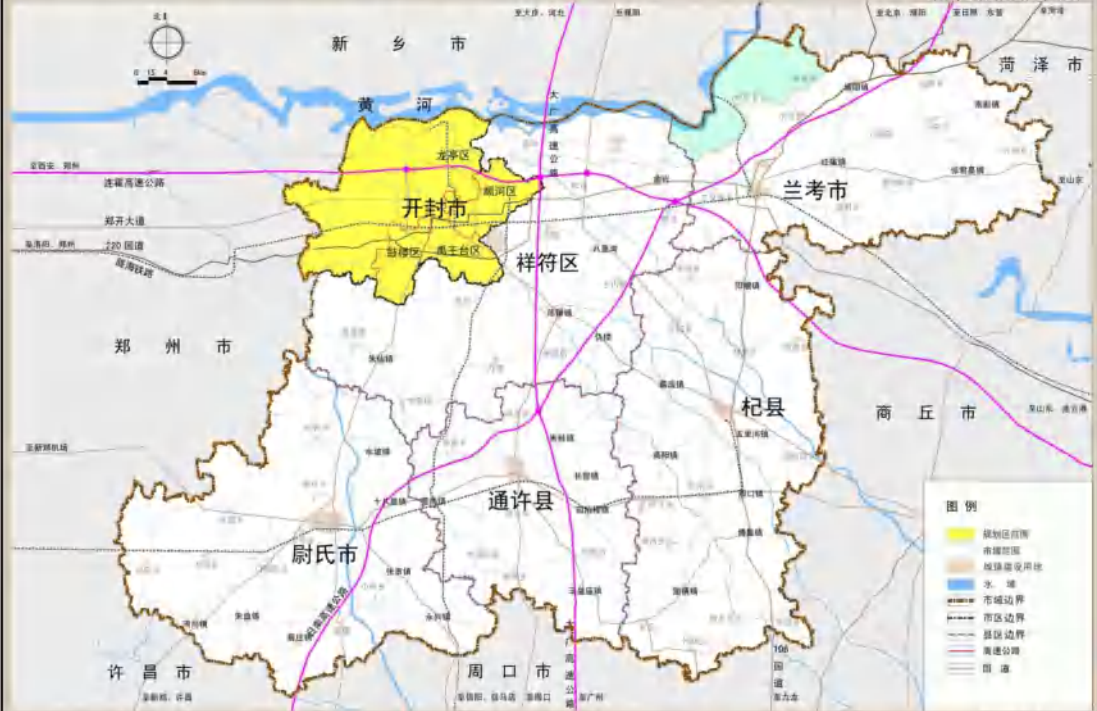
城市规划区范围图